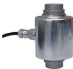
Högkvalitativa lastceller av typ Flintec RC3-30t