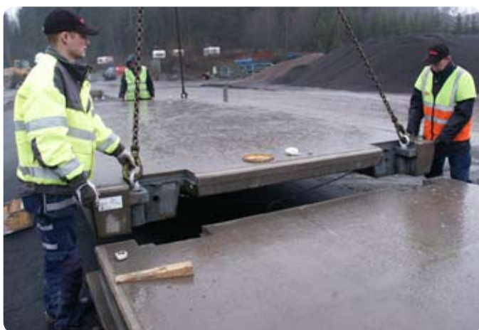
Montage av moduler för vågbrygga

Mellan vågbrygga och fundament placeras lastcellerna som är av mycket hög kvalitet med tanke på att vägen utsätts för stora påfrestningar både av stora laster och av tuff miljöpåverkan.