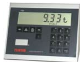
Viktindikator 47-10 med stor och tydlig display

Luckor för bra åtkomlighet vid service och rengöring