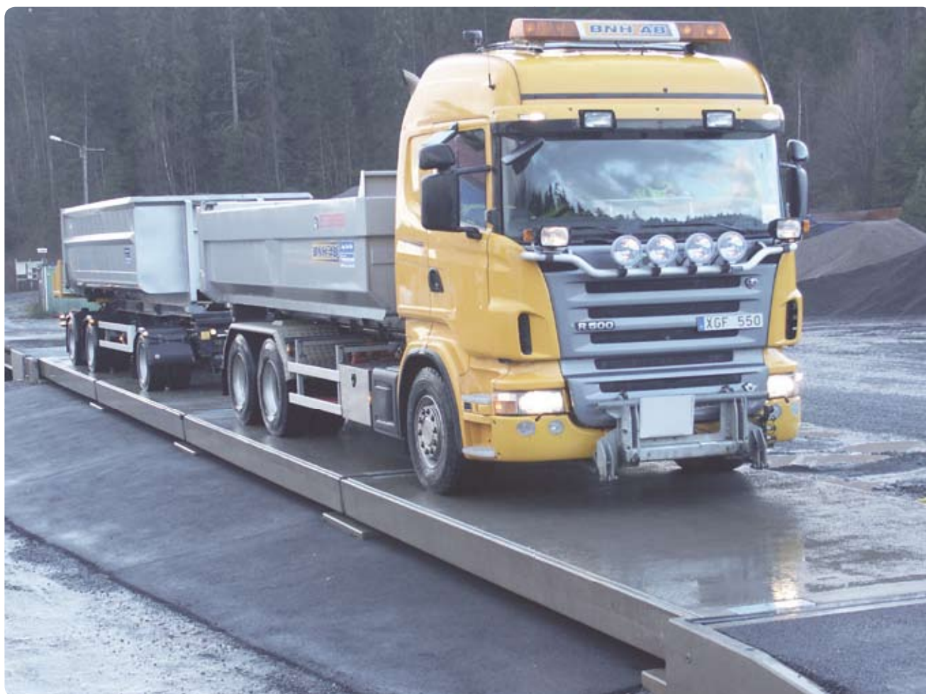
Fordonsvåg 14-10 med fundament för ovanpåliggande montage