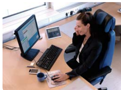
Manöverrum med vågens viktindikator och PC-system