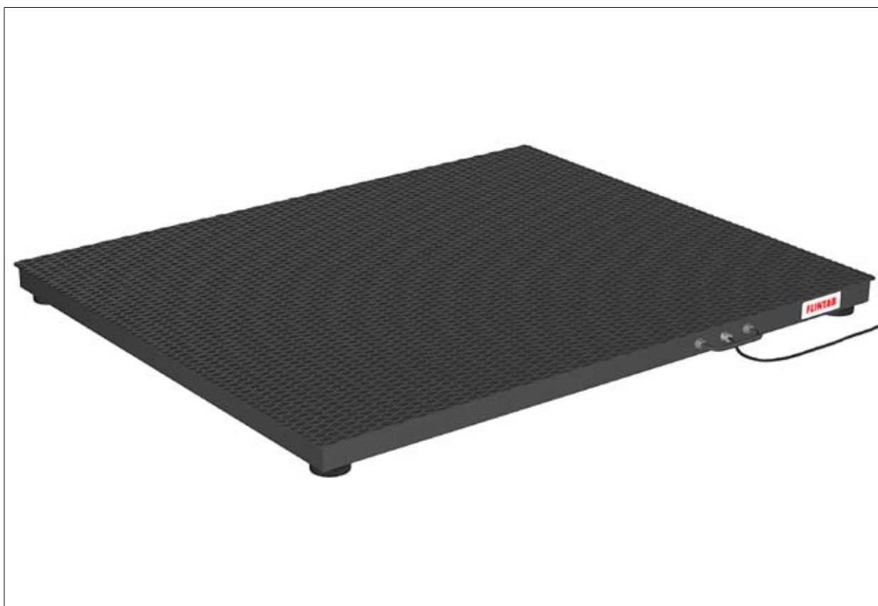
Godsvåg typ 13-02