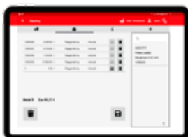
Lista med mätningar för pågående lastning