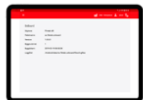
Val av anläggning