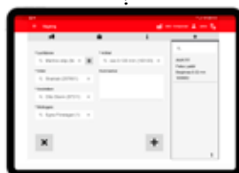
Manuell registrering av uppgifter då incheckade vägningar saknas