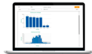
Grafiska och numeriska rapporter.