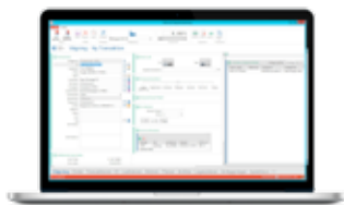
Webbaserat rapportprogram med personifierad åtkomst till information.