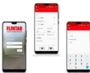
Mobil inloggning och identifiering.