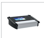
Våginstrument med registreringsfunktion