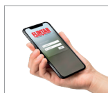
Viktoria mobil klient