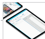
E-post av transaktionssedel & rapport