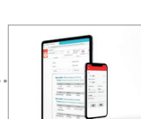
Flintab webbrapport och omklassning