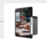
Flintab webbrapporter och omklassning