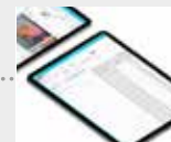
E-post av transaktionsedel & rapport