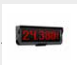
Stordisplay - vikt och textmeddelande