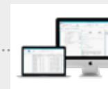
• Affärssystem • Transportbeställningssystem • Produktionssystem • Övriga system