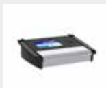
Våginstrument med registreringsfunktion