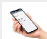
Viktoria mobil klient